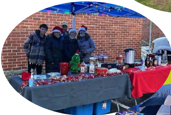
Activité de Noël sous la pluie!