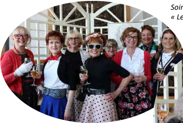
Soirée reconnaissance des bénévoles « Les années 50-60 »