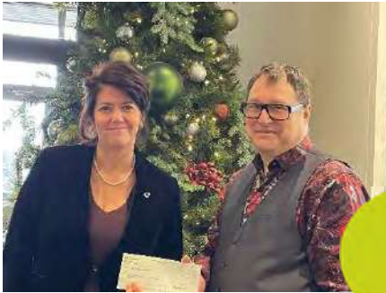
Remise de chèque de la Caisse Desjardins du Mont Saint-Bruno