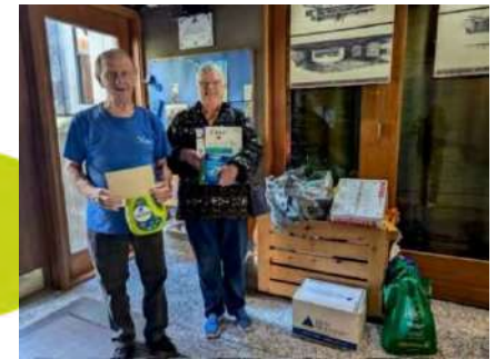
Remise de produits d'hygiène de la SA Women's Guild