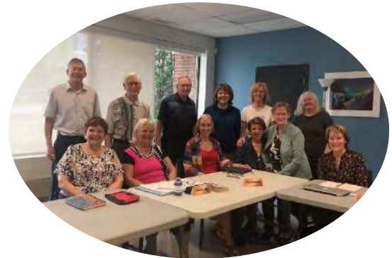
Bénévoles et participants à un atelier de conversation en anglais

Les ateliers de conversation en anglais ce sont : 64 ateliers, 468 heures bénévoles, 6 bénévoles et 41 participants!