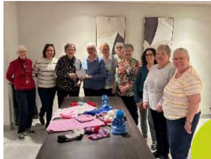
Remise d'un chèque et de plusieurs articles confectionnés à la main par le comité de tricot du Jazz St-Bruno