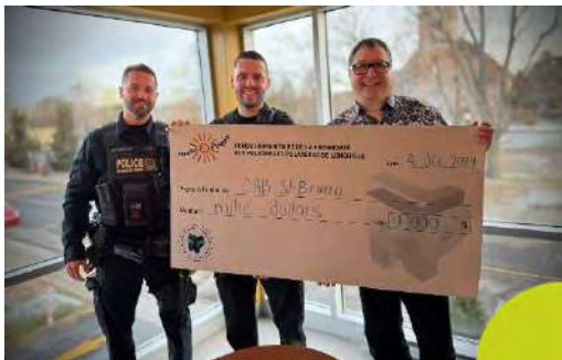
Remise de chèque du Fond humanitaire de la fraternité des policiers et policières de Longueuil