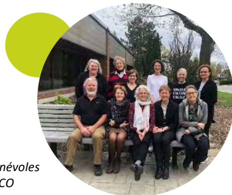
Certains des bénévoles présents au COCO

Ce sont 102 heures de bénévolat qui ont été consacrées aux rencontres du COCO .