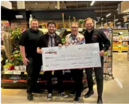
Remise de chèque de IGA extra Les Marchés Lambert