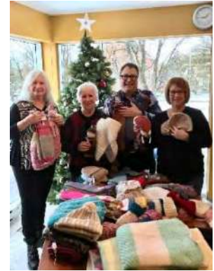
Remise de plusieurs articles confectionnés à la main par le Cercle de Fermières de St-Bruno