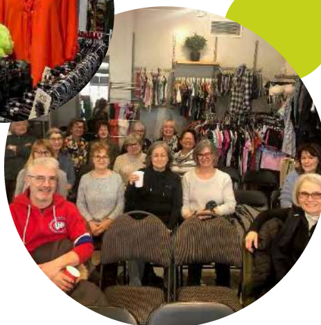
Plusieurs des bénévoles à la Friperie!