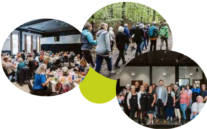
Activités dans le cadre de la Journée internationale des aînés

Les activités d'intégration sociale et services spécialisés pour les aînés ce sont : 229 activités/services spécialisés, 288 heures bénévoles, 63 bénévoles et 1 209 participants!