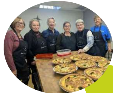
Bénévoles et participantes à la cuisine collective

Le service de la cuisine collective c'est : 439 portions cuisinées, 93 heures bénévoles, 6 bénévoles, 19 cuisines collectives et 16 participants!