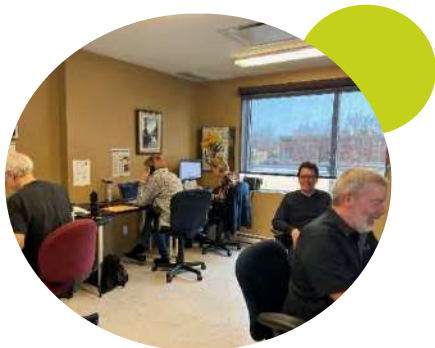
Bénévoles en action à la clinique d'impôt

Le service de la clinique d'impôt c'est : 376 rapports produits, 491 heures bénévoles, 7 bénévoles et 179 usagers!