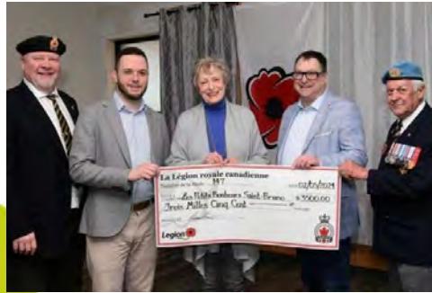
Remise de chèque de la Légion Royale Canadienne Filiale 147, Montarville