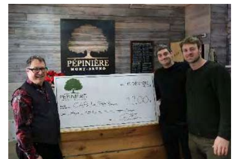
Remise de chèque de la Pépinière Mont-Bruno