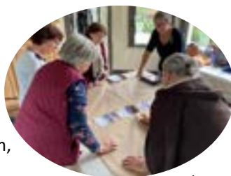
Atelier « La Fresque du Climat » avec Mères au front Rive-Sud

254 activités/services spécialisés 342 heures bénévoles 42 bénévoles 889 participants