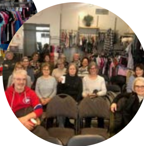
Plusieurs des bénévoles à la Friperie!