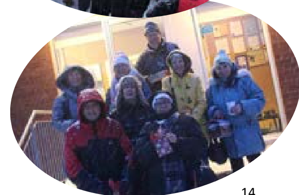
Soirée reconnaissance des bénévoles « La fièvre du Disco des p'tits bonheurs »