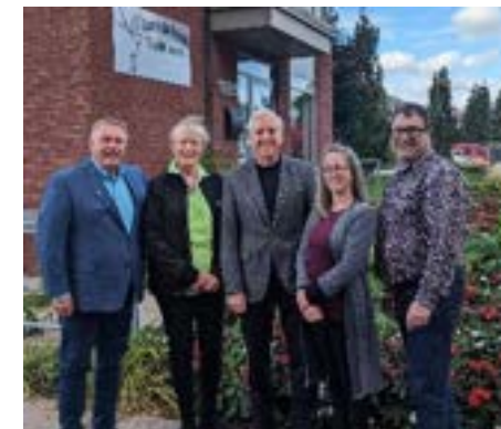
Remise de chèque de la Fondation du Club Richelieu