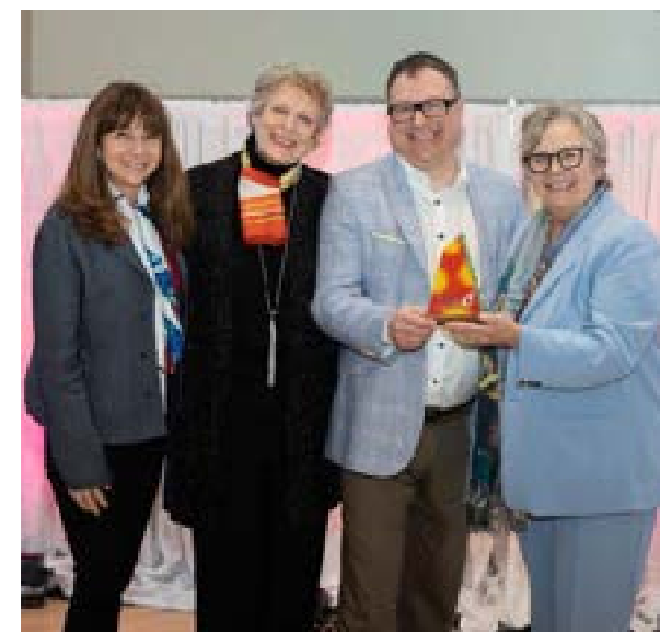
Prix Hommage bénévolat-Québec