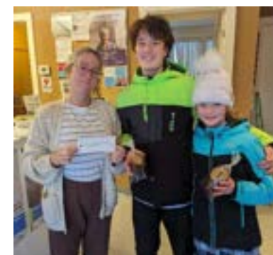
Remise de chèque de deux jeunes grâce à la vente de biscuits maison