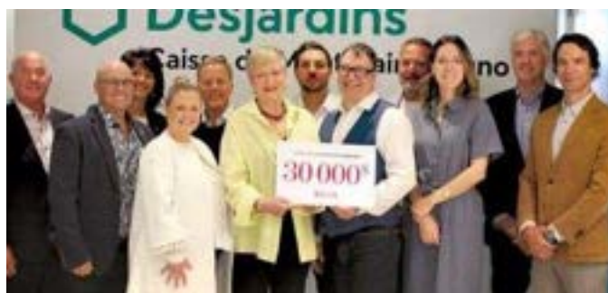
Remise de chèque Les Versants du Mont-Bruno dans le cadre du Tournoi de golf bénéfice des Versants du Mont-Bruno