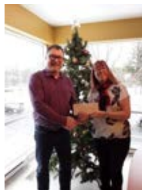
Remise de chèque de l'AREQ-CSQ, secteur Lajemmerais