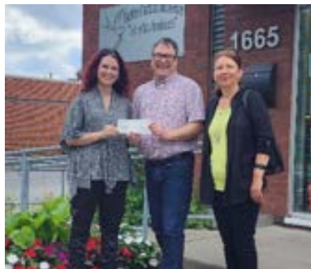
Remise de chèque de la Banque Laurentienne du Canada