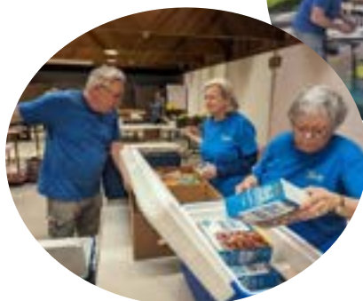
Bénévoles en action au comptoir alimentaire