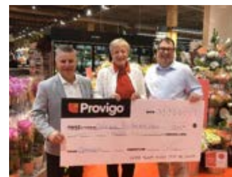
Remise de chèque de Provigo Le Marché