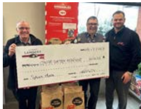
Remise de chèque de IGA extra Les Marchés Lambert