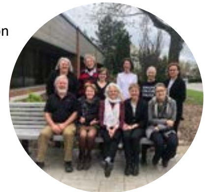
Certains des bénévoles présents au COCO

Pour les services aux individus 20 705 heures bénévoles 421 bénévoles 12 625 services rendus 2 516 participants