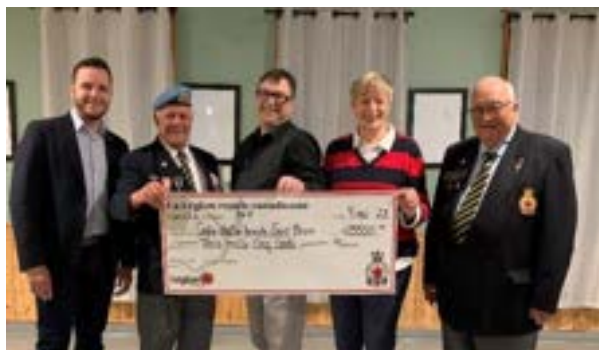
Remise de chèque de la Légion Royale Canadienne Filiale 147, Montarville