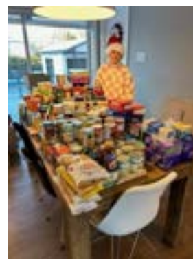
Remise de denrées pour le comptoir alimentaire, collecte effectuée par une jeune fille de Saint-Bruno